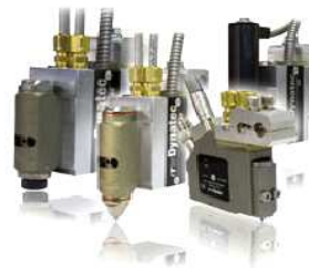
"BF-Bead and spray"-головка