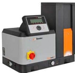
Dynamelt® S 5/10/22/45 кг 2-4-6 выхода