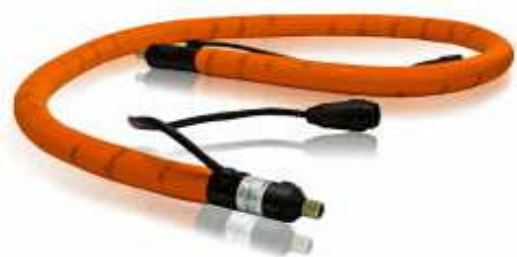
Dynaflex® шланг L = 1.2-7.3 м