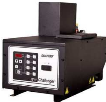
Quattro® До 9 кг/ч, объем 5 кг 4 выхода