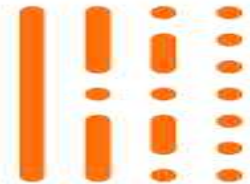
Скорость циклов/ в сек.