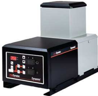
Dynamini® До 8 кг/ч, объем 5 кг 2 выхода