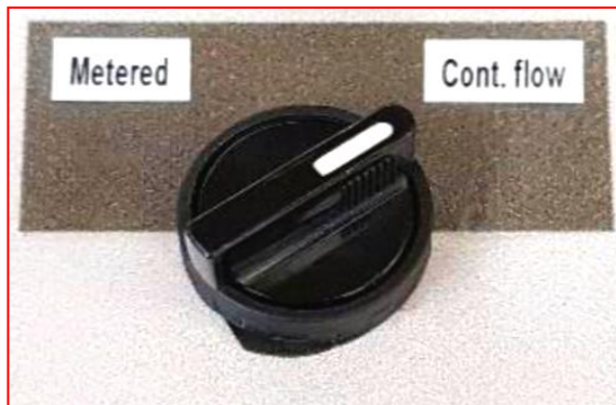
Doseerimine ja tavapealekandmine