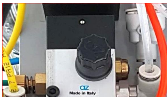
Pneumotaimer tsükli pikkuse regulaator