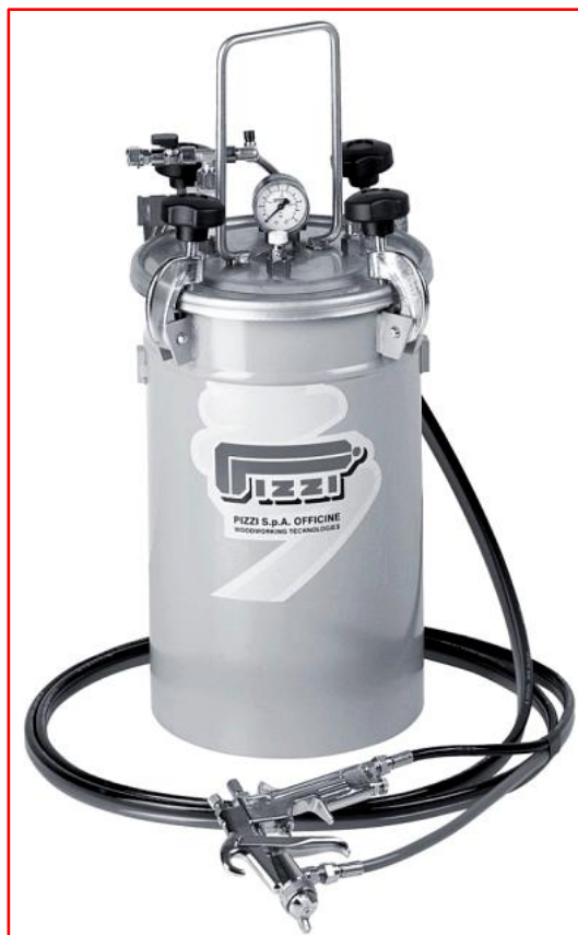
D12 10L | D20 15L